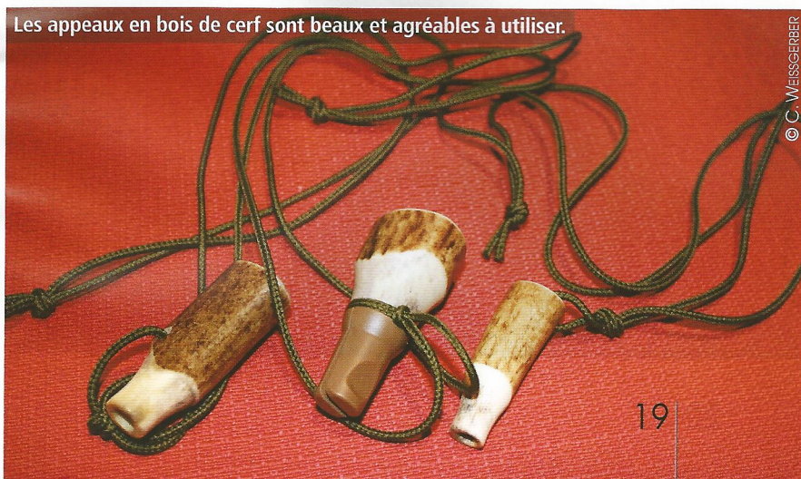
Les appeaux en bois de cerf sont beaux et agréables à utiliser.