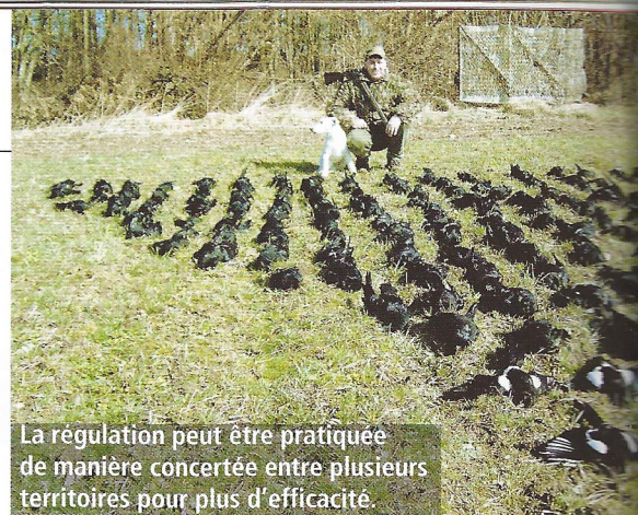
La régulation peut être pratiquée de manière concertée entre plusieurs territoires pour plus d'efficacité.

Si vous utilisez des appelants « amis », utilisez aussi l'appeau imitant les appels des